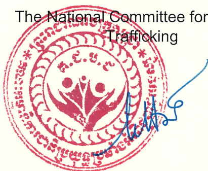
H.E. CHOU BUN ENG Permanent Vice-Chair

The National Committee for Counter Trafficking